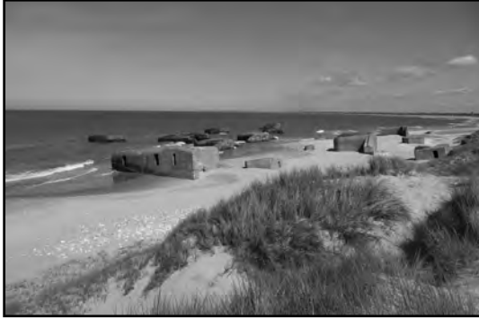
Bunker am Strand