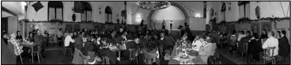
Geselliges Beisammensein beim Stiftungsfest 2010

Meldeschluss: 12. Januar 2012 (nach Meldeschluss 15 €, am Abend 20 €)