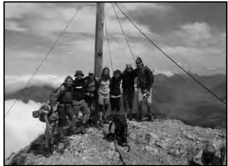
Auf dem Gipfel des Iseler

Nach einem, wie schon am Vortag getesteten, sehr guten Frühstück, packten wir unsere Sachen um nach Oberjoch zu kommen. Wir starteten bei schönem Wetter von der JUBI aus, um den Eine-Stunde-Aufstieg nach Oberjoch anzugreifen. Als dies geschafft war, gönnten wir uns eine Pause um anschließend mit der Seilbahn nach oben befördert zu werden. Nun war es nur eine Stunde bis zum Einstieg des Salewaklettersteigs. Dort machten wir kurz Pause um den Klettergurt mit Klettersteigset anzuziehen und den Helm aufzusetzen, dann endlich konnte es losgehen. Das Wetter war