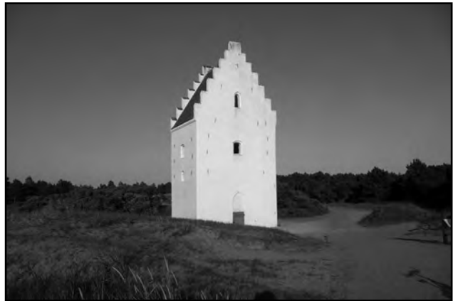
Mit Sanddünen verschüttete Kirche

Zurück nach Flensburg führen wir jetzt an der Ostsee auf dem Radweg Nr. 5. Die Ostseite Jütlands ist durch die Eiszeit ziemlich bergig geformt, fast wie zu Hause. Am Meer entlang führte kein Radweg. Hin und wieder erblickten wir einen steilen Weg hinunter zum Meer. Oft mussten wir eine vielbefahrene Straße nehmen, die allerdings einen breiten Radweg hatte. Das machte natürlich keinen Spaß, so wichen wir oft auf kleine Ortschaften aus. In der Nähe von Arhus radelten wir auf den höchsten Berg von Dänemark (173 m Yding Skovhøj).