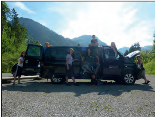
Wir sind endlich in den Alpen