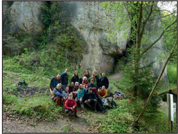
Jugendgruppe in Franken

Ende Septembers verabschiedeten wir uns mit einem Ausflug in das Bielatal vom Felsklettern 2011. In den kommenden Wintertagen werden unsere wett-kampfbegeisterten Kids in den letzten Wettkämpfen nochmal Gas geben, bevor sich alle ihre verdiente Weihnachtspause gönnen.