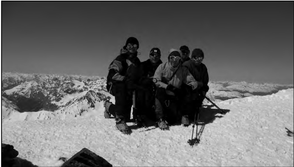
Fünf glückliche Skitourer