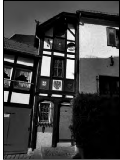
Das kleinste Haus von Blankenheim - 2,01 m breit