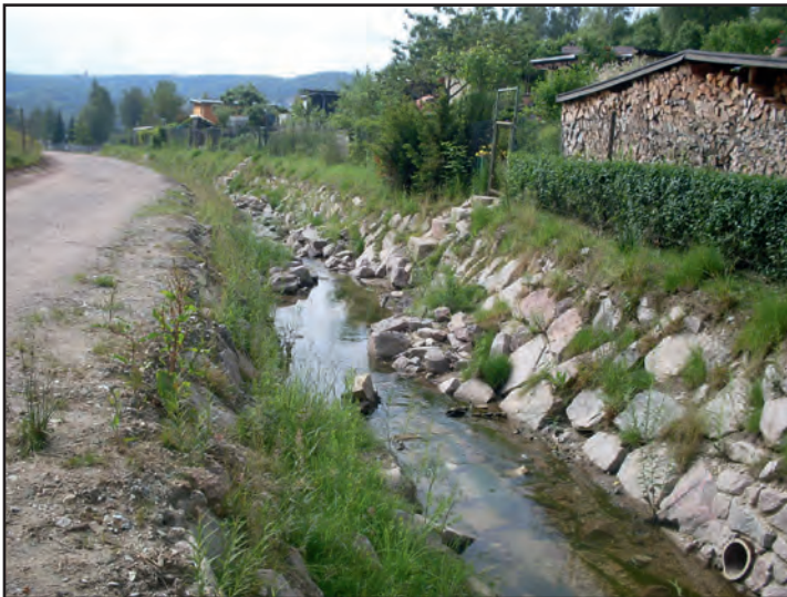
Der Silberbach als naturnahes Gewässer, ein Wechsel aus Stillwasserbereichen und hoher Fließdynamik

Neben der wasserbautechnischen Planung beinhaltet das Sanierungskonzept eine landschaftspflegerische Begleit- und Ausführungsplanung zur Umsetzung der Strukturverbesserung, welche insbesondere durch ingenieurbioologische Bauweisen bzw. Strukturelemente geprägt war. Der Umgang und die Entsorgung der radioaktiv kontaminierten Haldenmassen im Bachuntergrund stellten ein zusätzliches Problem dar. Nach Abschluss der Arbeiten 2010 am Silberbach werden die Synergieeffekte, die dieses Projekt beinhalteten, deutlich. Durch das verringerte Abfließen in die Grube wird das zu hebende und in der Wasseraufbereitungsanlage (Aufbereitung uranhaltiger Grubenwässer) zu reinigende Wasser reduziert. Das Gewässer weist jetzt durch seine Strukturvielfalt potentielle Habitate für eine standorttypische Besiedlung heimischer Tier und Pflanzenarten im Sinne der EU-WRRL auf. Das Silberbachtal ist darüber hinaus durch die sich in die Landschaft harmonisch einbindende Gewässerbegleitbegrünung ein weiterer touristischer Anziehungspunkt des Kurortes Bad Schlema geworden. Mit dem Hochwasserereignis im August 2010 wurde der Gewässerausbau einer ersten Bewährungsprobe ausgesetzt. Ohne Schäden am Gewässer und an der Infrastruktur zeigte sich die Wirksamkeit des naturnahen Gewässers.