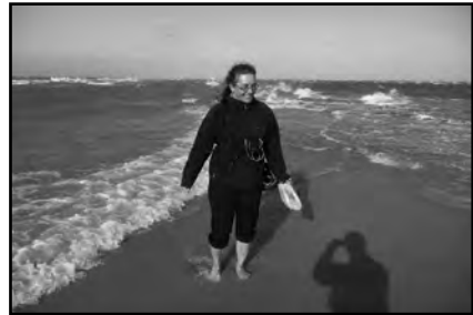
Nordspitze Dänemarks - Skagen

Insgesamt legten wir 1.250 km in zwei Wochen zurück. Wind kam von allen Seiten und reichlich. Der Regen hielt sich in Grenzen. Zum Baden war es im Juni noch zu kalt. Ich war trotzdem einmal in der Nordsee und einmal in der Ostsee baden. Zwei Wochen sind auf jeden Fall zu kurz. Es war zwar ganz schön anstrengend, aber mit vielen neuen und schönen Eindrücken zurückgekehrt, können wir diese Radrunde auf jeden Fall empfehlen.